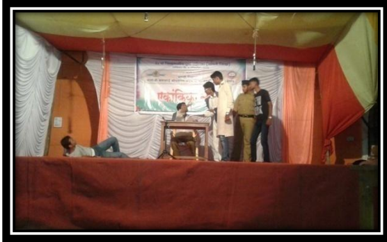
Ekankika Participation by Students