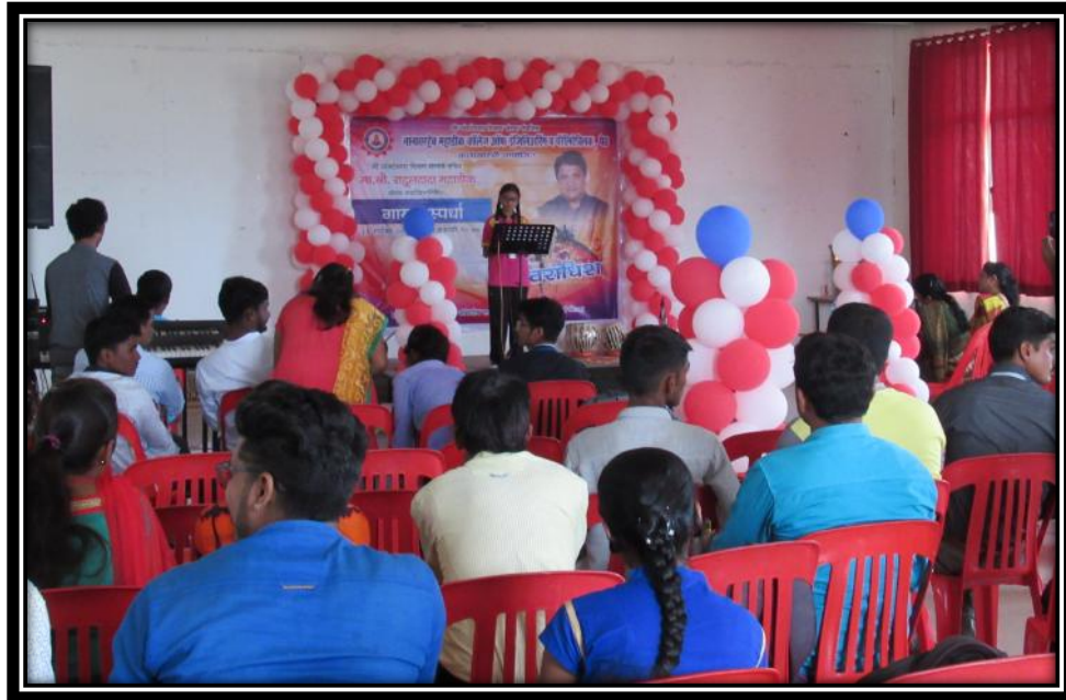
मोठा गट - गायन स्पर्धा