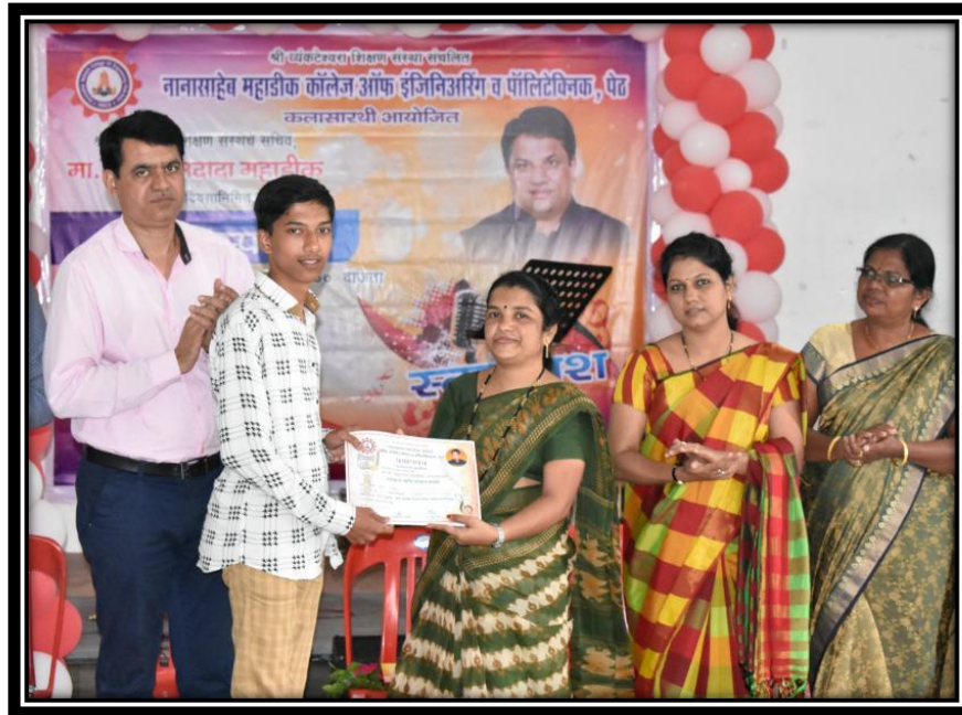
बक्षीस वितरण समारंभ