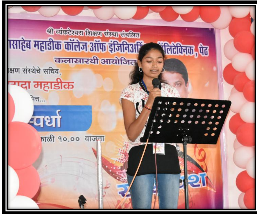
मोठा गट - गायन स्पर्धा