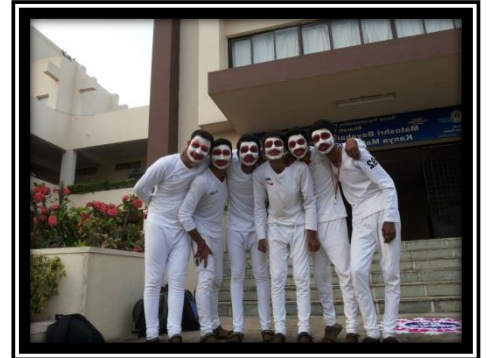
Mime Participation by Students