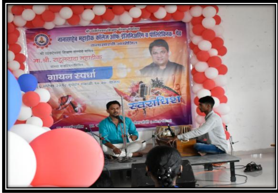
मोठा गट - गायन स्पर्धा