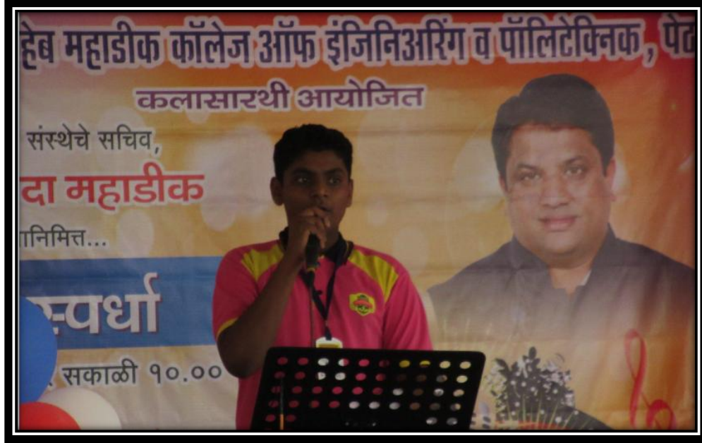
लहान गट - गायन स्पर्धा