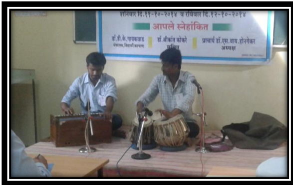
Central Youth Festival- Tal Vadya Participation