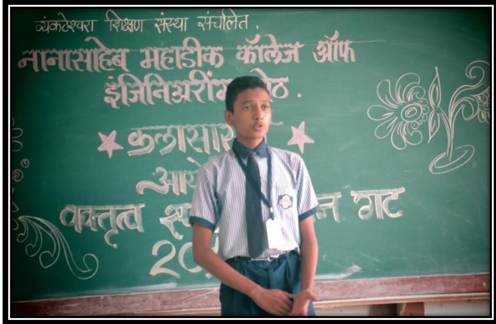
लहान गट - वक्तृत्व स्पर्धा