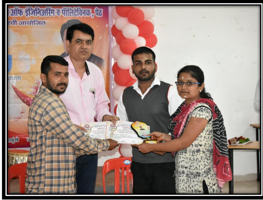
बक्षीस वितरण समारंभ