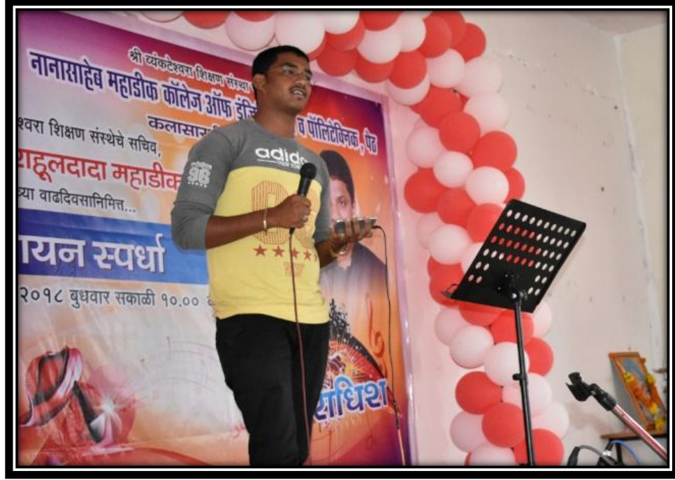
मोठा गट - गायन स्पर्धा