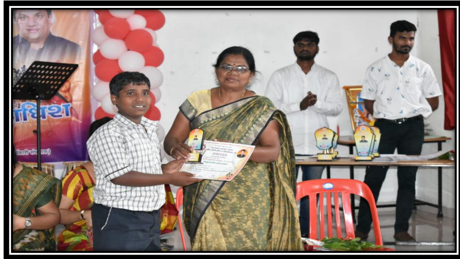
लहान गट - वक्तृत्व स्पर्धा